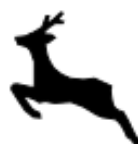
A, 15 b